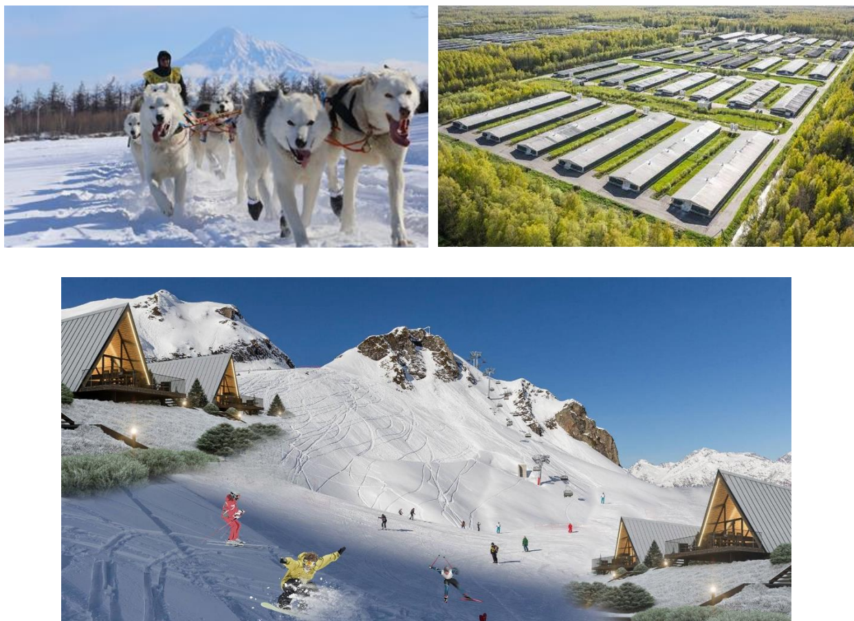
Рисунок 3 – Основные направления туризма в селе Эссо

Для реализации программы горнолыжного туризма предлагается обеспечить сообщение с территорией отеля путем устройства пешеходного моста со смотровыми площадками и фотозонами.