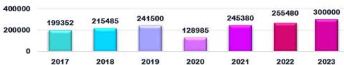
Рисунок 2 – Диаграмма общего числа обслуженных туристов Камчатки

Грамотная стратегия позволит, при необходимости, своевременно вносить коррективы в вектор развития муниципального пространства, а гибкие и креативные территориально-планировочные решения позволят: создать отдельные многофункциональные зоны; изменить приоритетные направления, исходя из меняющихся условий; сохранить основную градостроительную канву архитектурно-строительного проектирования объектов недвижимости и сложившейся инфраструктуры.