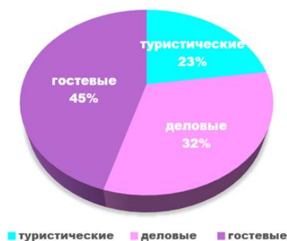
Рисунок 1 – Структура целей поездок в Камчатский край

Малым городам и сельским поселениям сложно соответствовать изменчивой геополитической и экономической ситуации, эти причины известны: недостаточные темпы развития инфраструктуры; ограниченный бюджет для реализации функциональных трансформаций; сложная ситуация с кадровым потенциалом.