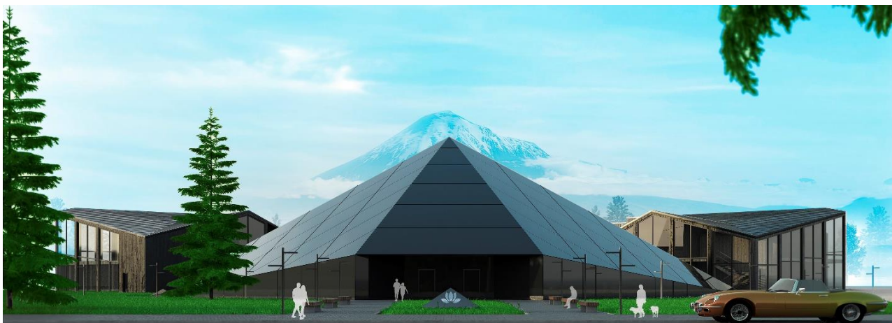
Рисунок 4 – Главный фасад комплекса

Архитектурный облик обусловлен функциональным назначением и выполнен в стиле супрематизма из простых геометрических форм – преимущественно темных цветов, символизирующих открытость и бесконечность. Учтена сочетаемость цветов архитектурных объектов и природной сезонной динамики времен года.